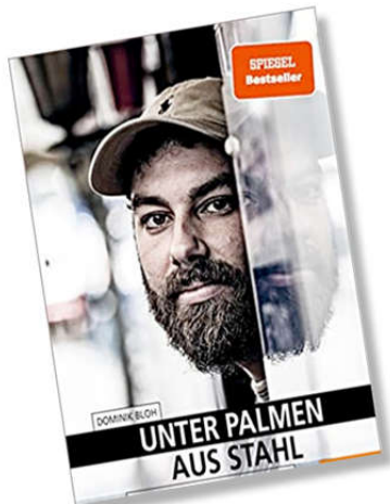
Abb.: Titel des Buches von Dominik Bloh