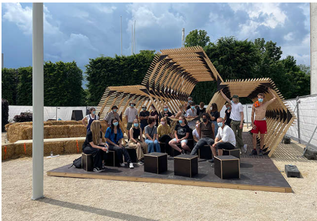
Abb.: Die Beuys-Plattform auf dem Museumsplatz, Foto: Benedikt Stahl, Alanus Hochschule für Kunst und Gesellschaft, Fachbereich Architektur

Alternative Lebensentwürfe, die unsere Arbeitswelt, Wirtschaft, Grundeinkommen, Ökologie, Nachhaltigkeit, Demokratie und gesellschaftliches Handeln betreffen, werden hier mit Menschen besprochen, die die wahren Expert*innen sind: Weil sie bereits ausprobieren, wie es anders geht. Im Fokus des Gesprächs mit Expert*innen stehen Fragen zur alternativen Ökonomie. Nehmen Sie teil und bringen Sie sich ein!