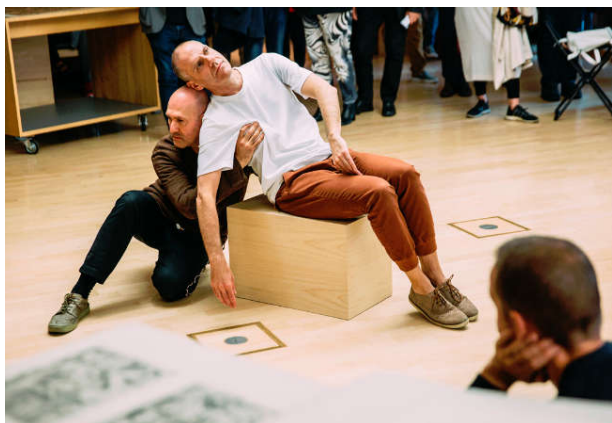
Prinz Gholam, © SKD, Foto: Oliver Killig

Donnerstag, 28. Oktober 2021, 18 bis 19 Uhr