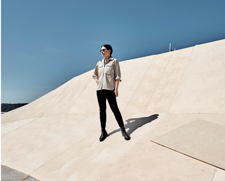
Bettina Pousttchi, The Curve, 2022, Aufbau / Installation process (c) Bettina Pousttchi, Foto: Norbert Miguletz

Pressesprecher Sven Bergmann T +49 228 9171-205 F +49 228 9171-211 bergmann@bundeskunsthalle.de